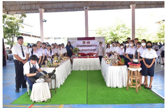
โครงการการนำเสนอผลงานรายวิชาโครงการ ปีการศึกษา ๒๕๖๖ ระดับ ปวช.๓ และ ปวส.๒ ในวันศุกร์ที่ ๑๕ กันยายน ๒๕๖๖ ณ อาคารอเนกประสงค์ วิทยาลัยเทคนิคลำพูน