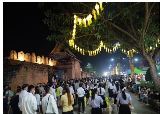
โครงการส่งเสริมขนบธรรมเนียม ประเพณีวัฒนธรรมท้องถิ่น ประเพณีลอยกระทง ในวันที่ ๙ พฤศจิกายน ๒๕๖๖