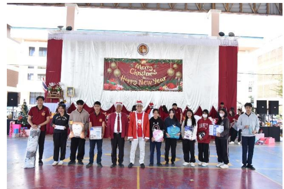
โครงการ Cristmas Day สำหรับนักเรียน นักศึกษา วิทยาลัยเทคนิคลำพูน ประจำปี การศึกษา ๒๕๖๕