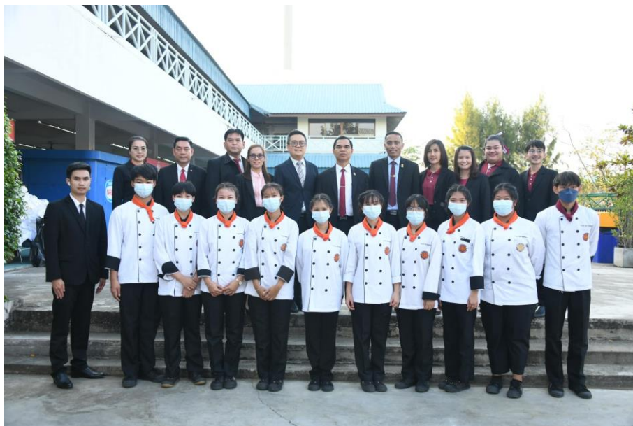
โครงการ ประชุมวิชาการปัจจุบันสู่อนาคตการผลิต และพัฒนากำลังคนอาชีวศึกษาสมรรถนะสูง เพื่อการพัฒนาประเทศ "สื่อสาร ส่งเสริม สู่การปฏิบัติ" ในวันอาทิตย์ที่ ๘ มกราคม ๒๕๖๖ ณ วิทยาลัยเทคนิคลำพูน จังหวัดลำพูน