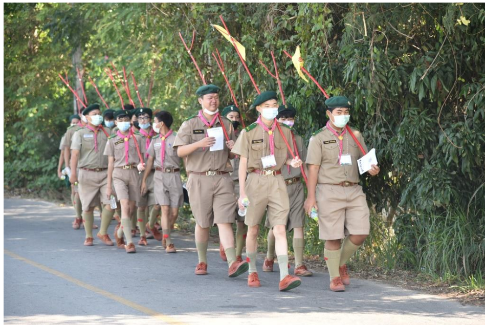
วิทยาลัยเทคนิคลำปาง จัดกิจกรรมเข้าค่าย ลูกเสือ เนตรนารี ปีการศึกษา ๒๕๖๕ ในระหว่างวันที่ ๒๐ - ๒๒ มกราคม ๒๕๖๖ ณ ค่ายลูกเสือเนตรนารีชั่วคราว วิทยาลัยเทคนิคลำปาง