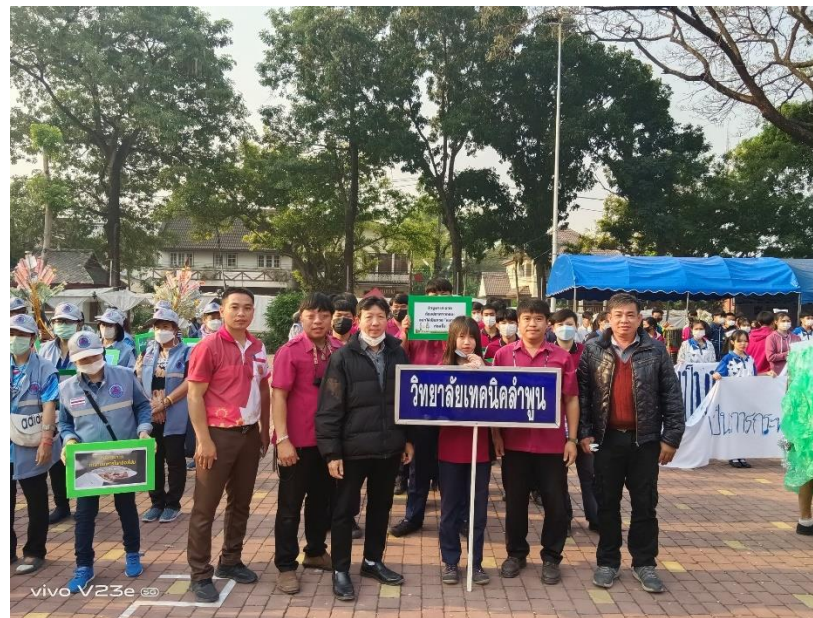
แผนกวิชาช่างยนต์ นำนักเรียน นักศึกษา เข้าร่วมโครงการผ้าป่าขยะรีไซเคิล เทศบาลเมืองลำพูน ประจำปีงบประมาณ ๒๕๖๖ ในวันพุธที่ ๑๕ กุมภาพันธ์ ๒๕๖๖