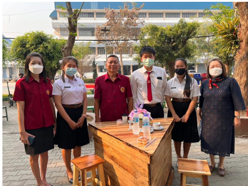
แผนกวิชาการเลขานุการและการจัดการสำนักงาน จัดแสดงผลงานรายวิชาโครงงาน ของนักเรียน ระดับชั้น ปวช.๓ และนักศึกษาระดับชั้น ปวส.๒ ในวันพุธที่ ๑๕ กุมภาพันธ์ ๒๕๖๖ ณ ลานอเนกประสงค์หน้าอาคาร ๖