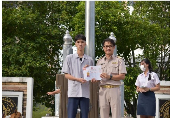
โครงการแข่งขันประกวดโปสเตอร์เด็กอาชีวะยุคใหม่ ห่างไกลยาเสพติด