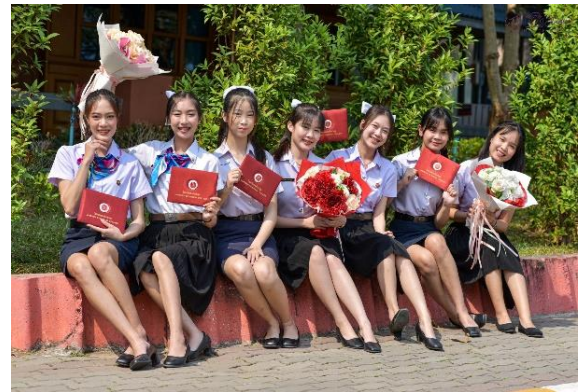
พิธีมอบใบประกาศนียบัตรผู้สำเร็จการศึกษา ประจำปีการศึกษา ๒๕๖๕ ในวันที่ ๑๖ มีนาคม ๒๕๖๖ ณ วิทยาลัยเทคนิคลำพูน