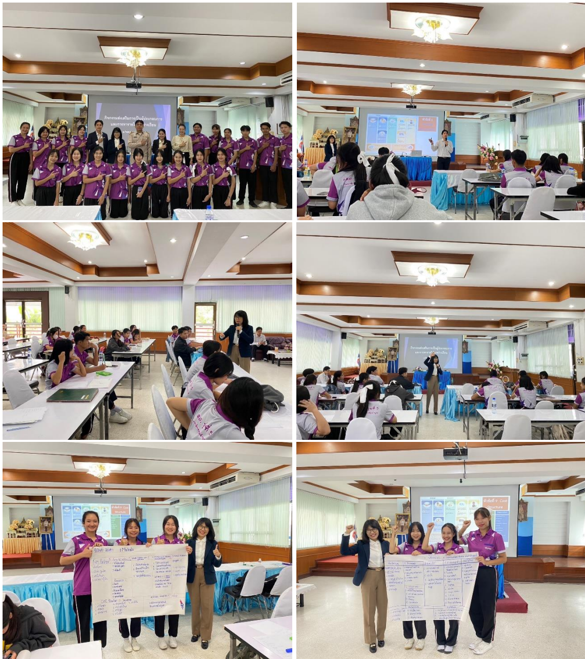
กิจกรรมการเป็นผู้ประกอบการ การหารายได้ระหว่างเรียน สำหรับนักศึกษาทุนนวัตกรรมสายอาชีพ ชั้นสูง (กสศ.) สาขาวิชาการจัดการโลจิสติกส์และซัพพลายเชน และสาขาอาหารและโภชนาการ ในวันจันทร์ที่ ๑๘ กันยายน ๒๕๖๖ ณ อาคารอำนวยการ วิทยาลัยเทคนิคลำพูน