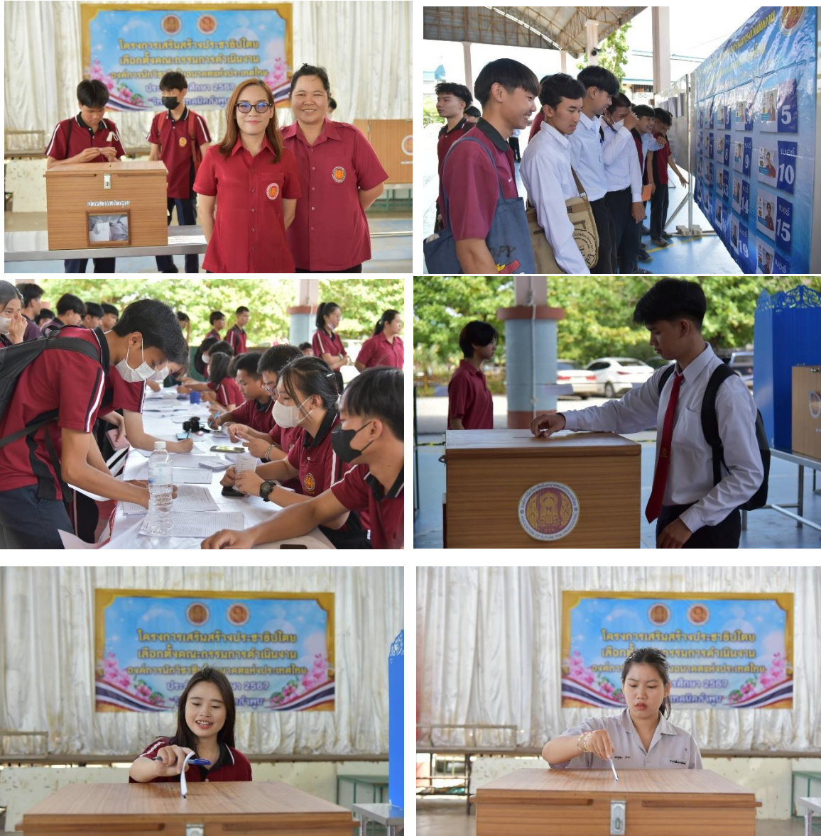
วิทยาลัยเทคนิคลำพูน จัดโครงการส่งเสริมประชาธิปไตย เลือกตั้งนายกองค์การนักวิชาชีฟ ในอนาคตแห่งประเทศไทย (อวท.) ประจำปีการศึกษา ๒๕๖๗ ในวันพุธที่ ๑๙ กรกฎาคม ๒๕๖๖