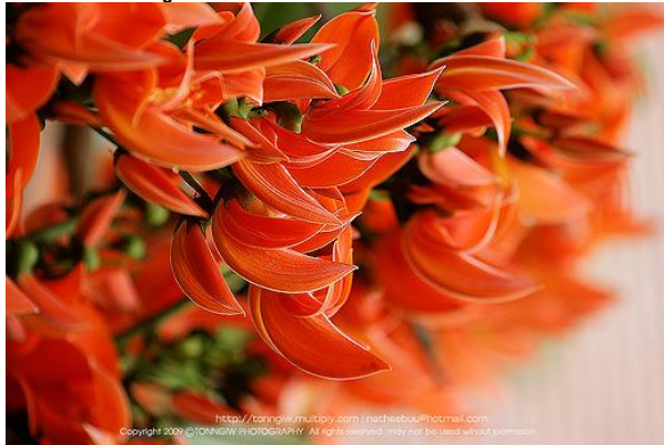
ชื่อ พรรณไม้ : ดอกทองกวาว/ ดอกจานเหลือง