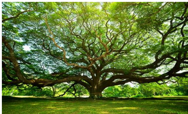
ชื่อ พรรณไม้ : จามจुरี